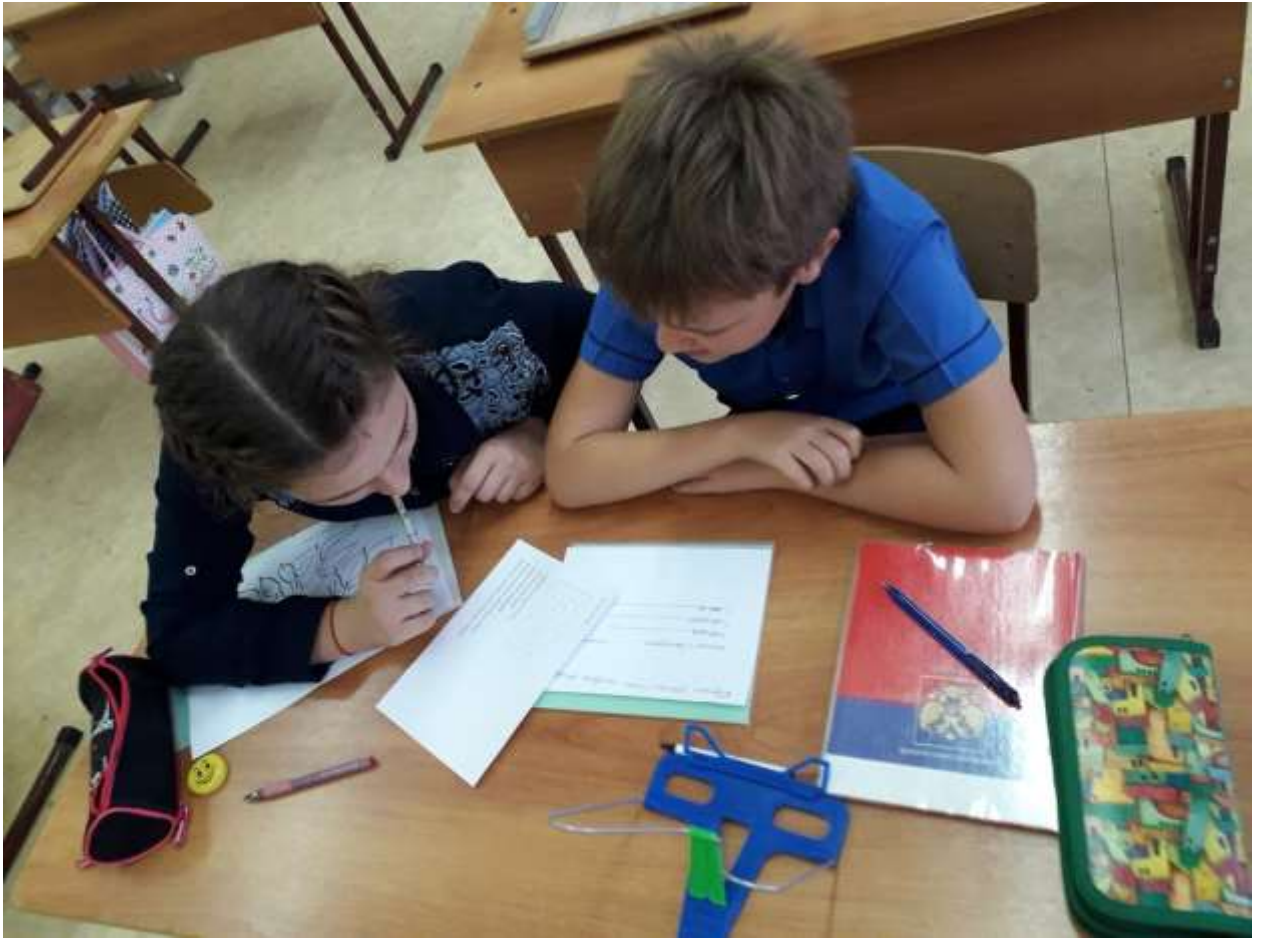
Разгадываем ребусы, отгадываем загадки.