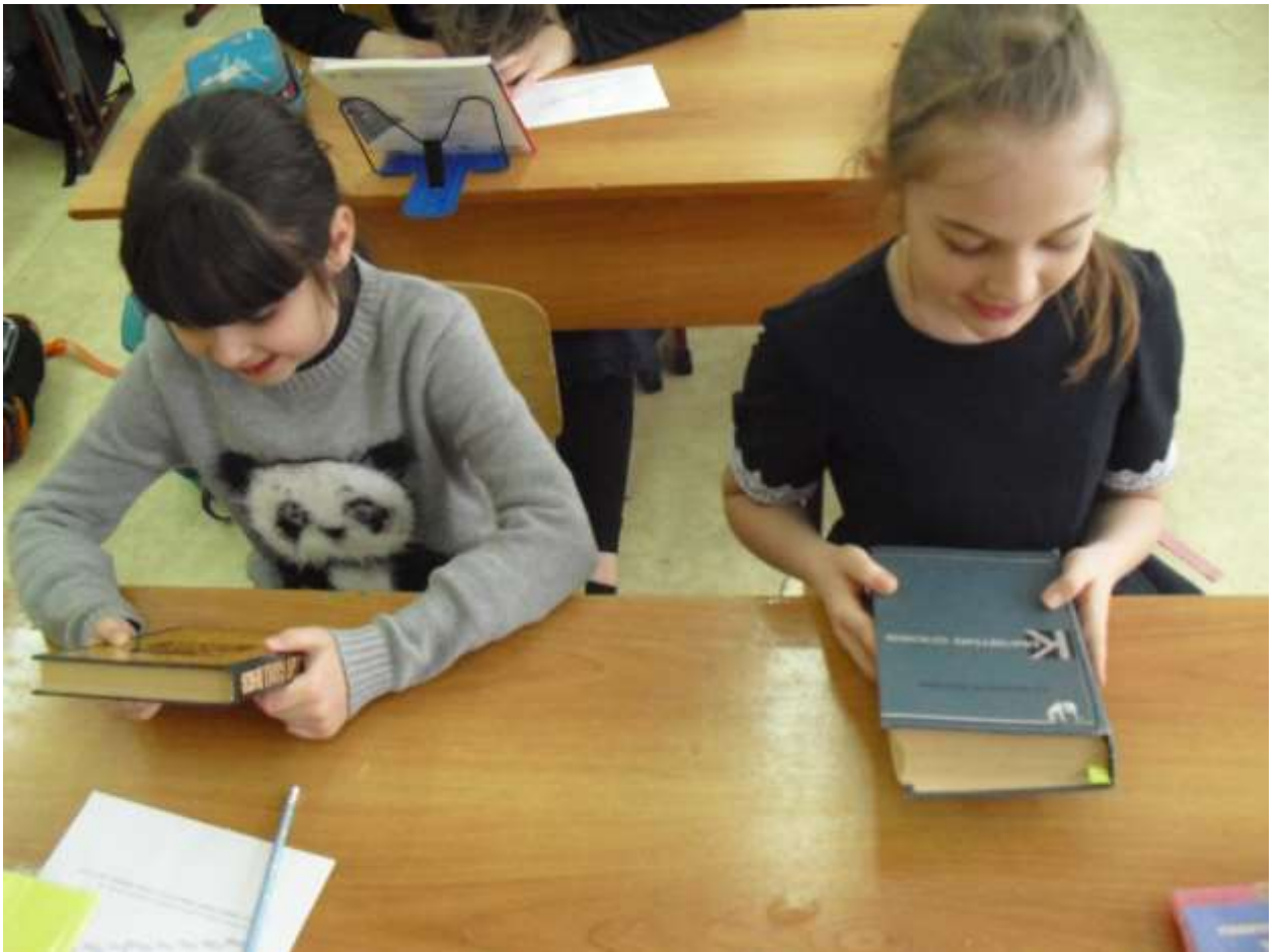
Знакомимся со словарями .