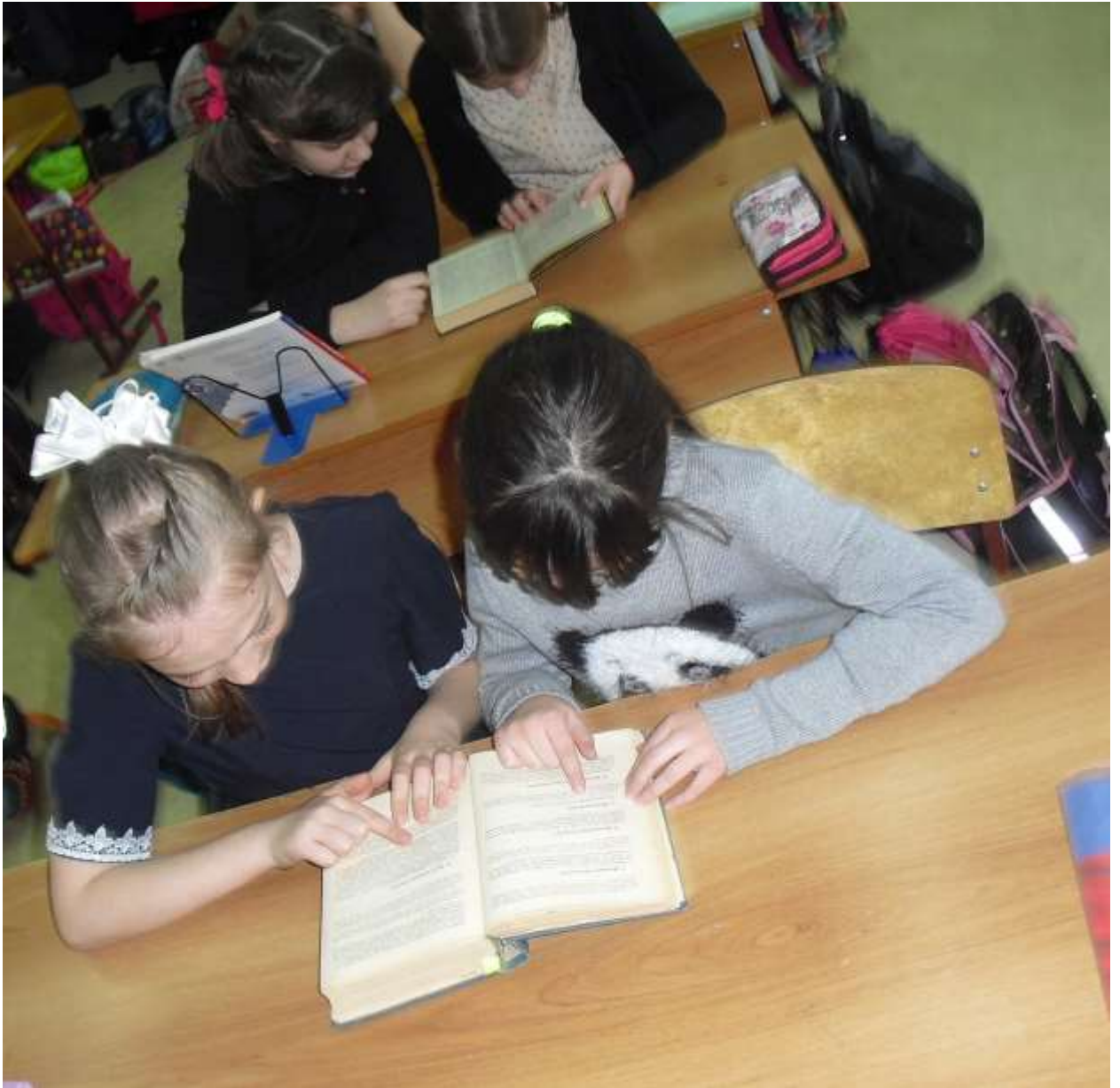
Учимся находить слова в словаре.