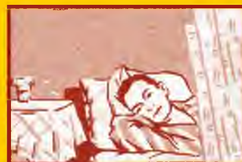
Избегайте контактов с заболевшими