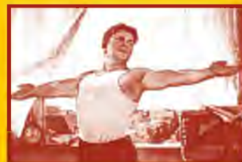
Ведите здоровый образ жизни