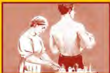
Сделайте прививку от гриппа