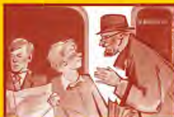
Ограничьте пребывание в местах скопления людей