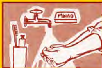
Регулярно мойте руки