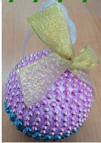
Евграфова Ксения 1 Б класс